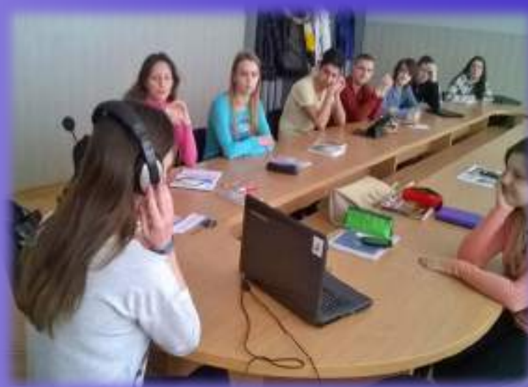
Практические занятия в группах