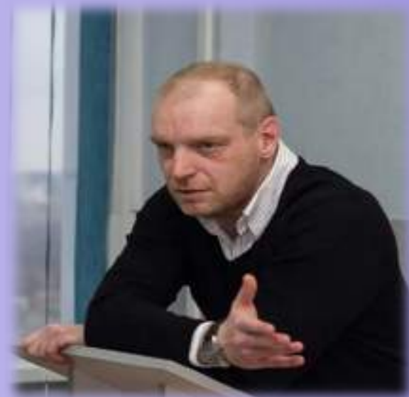
Немецкий военный репортёр и режиссёр- документалист Марк Барталмай 26 ноября 2015 г.