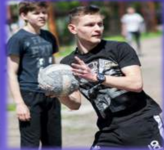
Спортивная игра «СНАЙПЕР»