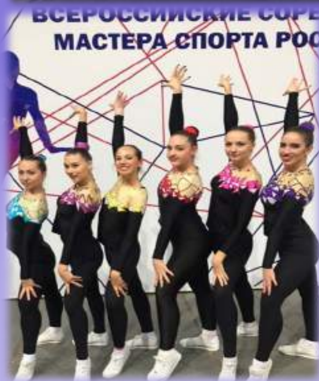
Спортсменки ФИЯ приняли участие в соревнованиях по аэробной гимнастике в Москве (17-22 ноября 2018)