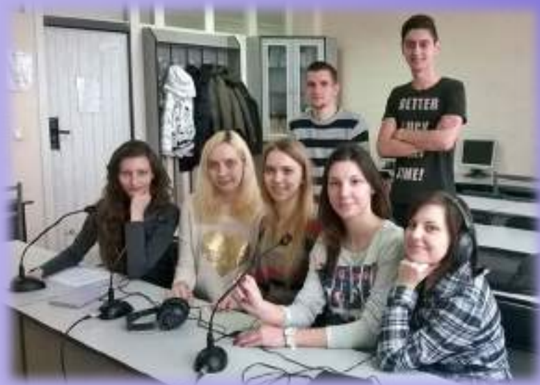
Занятие по синхронному переводу