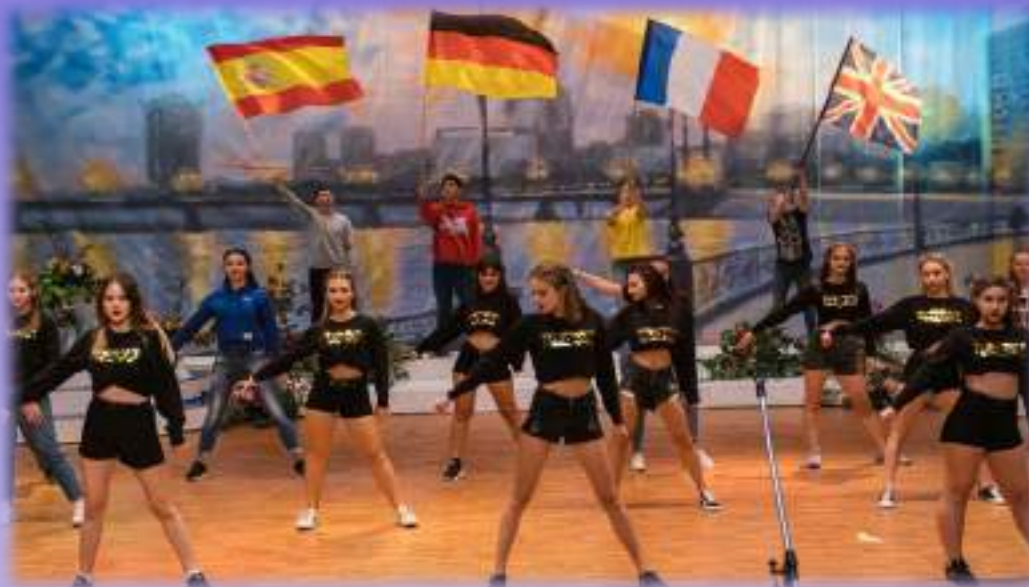
День переводчика и День учителя