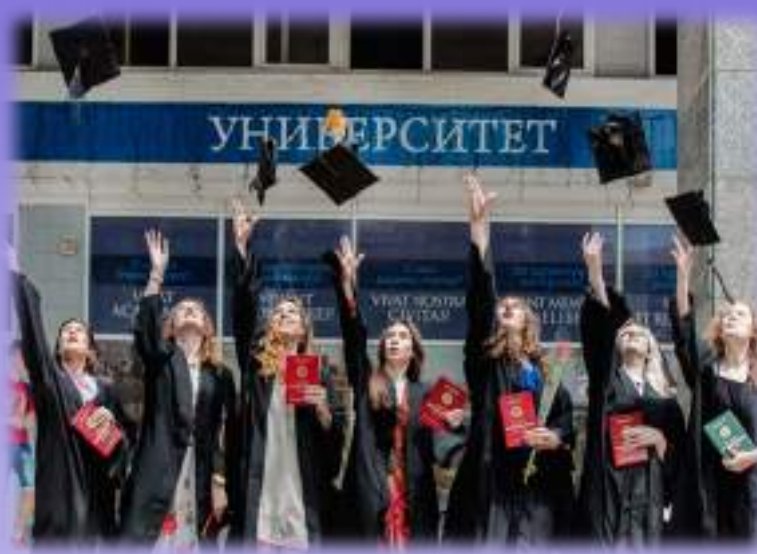
Вручение дипломов выпускникам