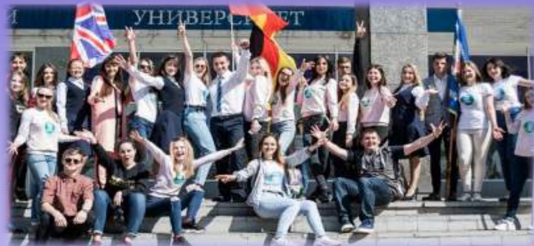
Торжественная линейка и праздничный флэш-моб у входа в Главный корпус