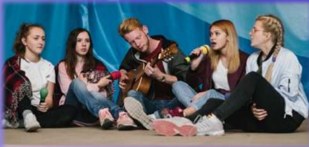
Смотр талантов первокурсников и старшекурсников