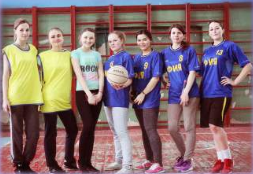
Команда студенток ФИЯ – победитель Университетских соревнований по баскетболу в 2018 г.